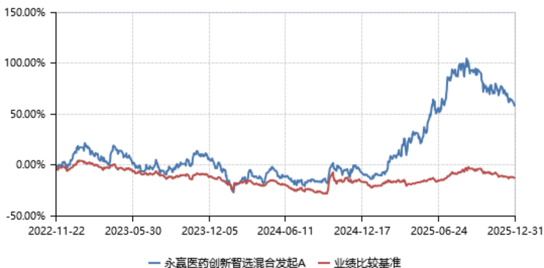
永赢医药创新智选混合发起A累计净值收益率与业绩比较基准收益率历史走势对比图 (2022年11月22日-2025年12月31日)