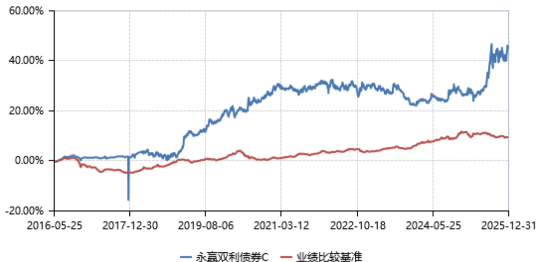
永赢双利债券C累计净值收益率与业绩比较基准收益率历史走势对比图 (2016年05月25日-2025年12月31日)