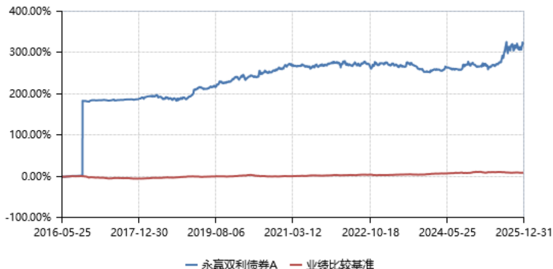
永赢双利债券A累计净值收益率与业绩比较基准收益率历史走势对比图 (2016年05月25日-2025年12月31日)