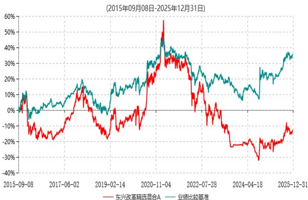
东兴改革精选混合A累计净值增长率与业绩比较基准收益率历史走势对比图