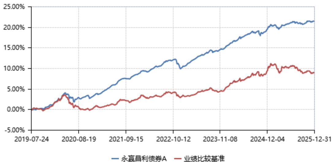
永赢昌利债券A累计净值收益率与业绩比较基准收益率历史走势对比图 (2019年07月24日-2025年12月31日)