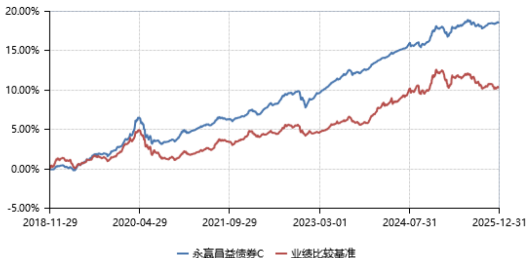
永赢昌益债券C累计净值收益率与业绩比较基准收益率历史走势对比图 (2018年11月29日-2025年12月31日)