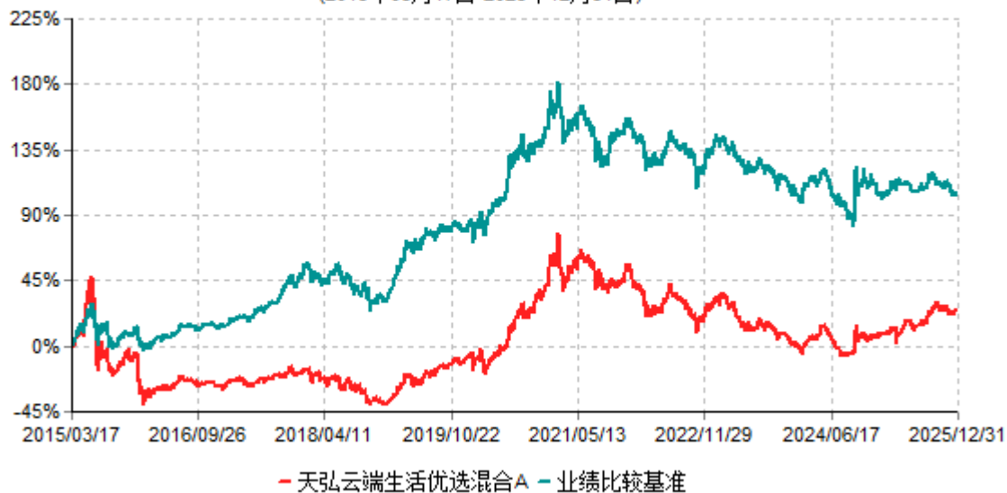
天弘云端生活优选混合A累计净值增长率与业绩比较基准收益率历史走势对比图 (2015年03月17日-2025年12月31日)