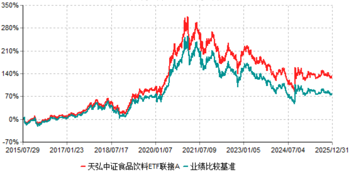
天弘中证食品饮料ETF联接A累计净值增长率与业绩比较基准收益率历史走势对比图 (2015年07月29日-2025年12月31日)