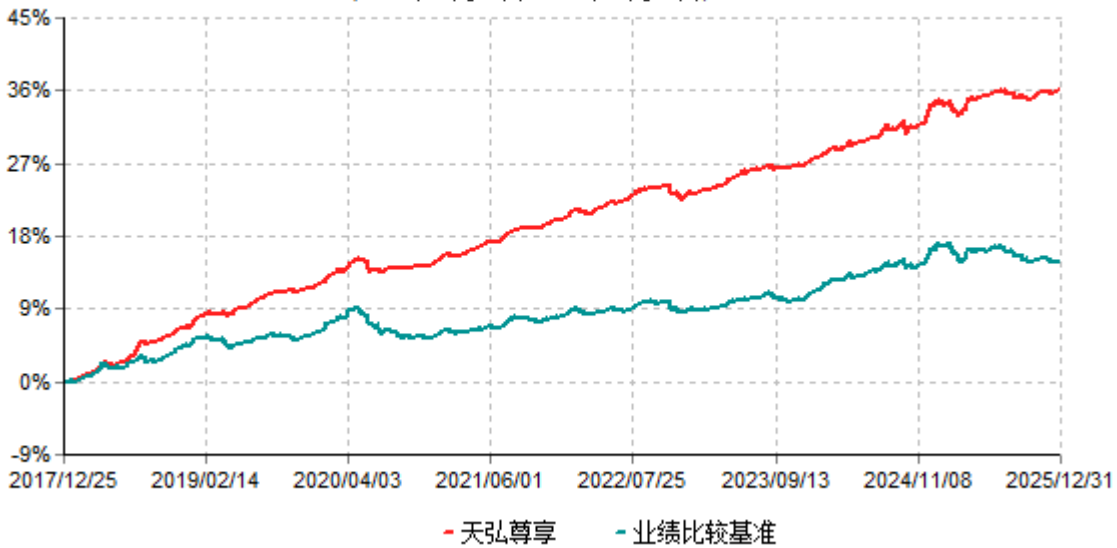
天弘尊享累计净值增长率与业绩比较基准收益率历史走势对比图 (2017年12月25日-2025年12月31日)