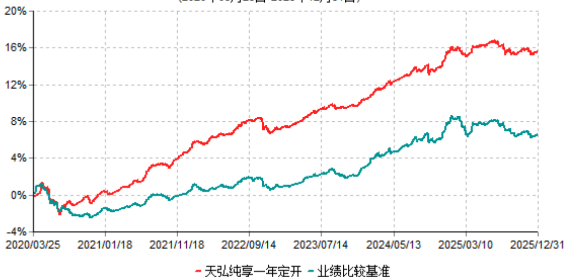
天弘纯享一年定开累计净值增长率与业绩比较基准收益率历史走势对比图 (2020年03月25日-2025年12月31日)