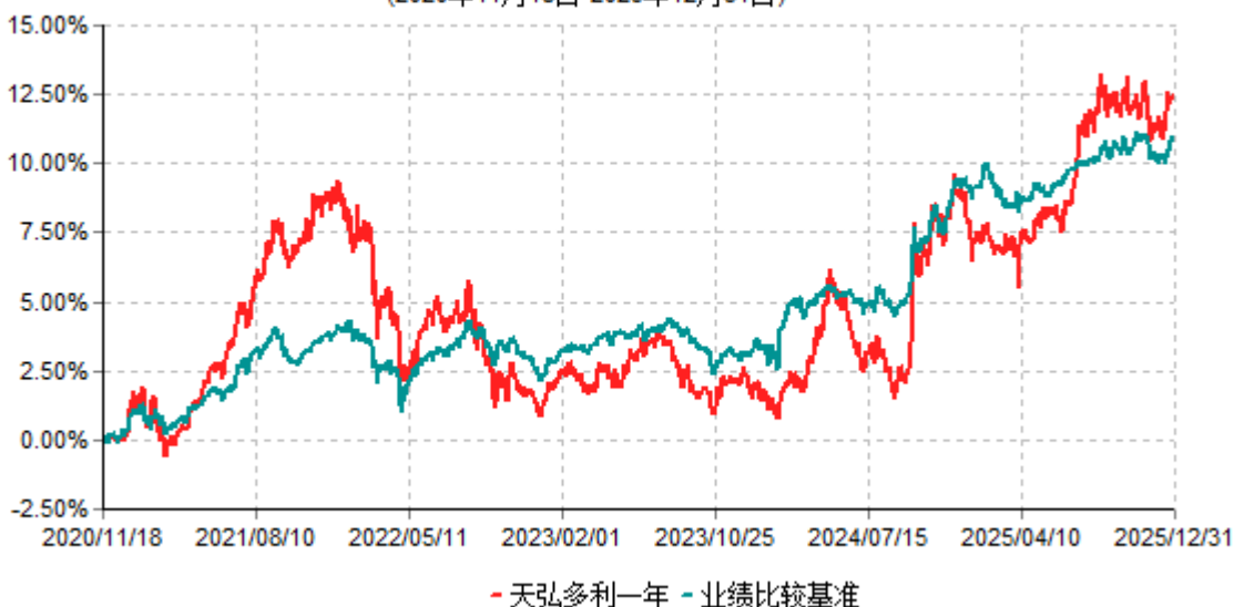
天弘多利一年累计净值增长率与业绩比较基准收益率历史走势对比图 (2020年11月18日-2025年12月31日)