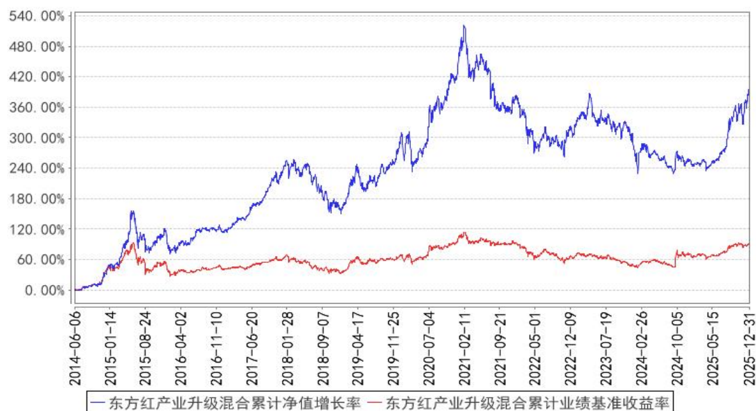
东方红产业升级混合累计净值增长率与同期业绩比较基准收益率的历史走势对比图