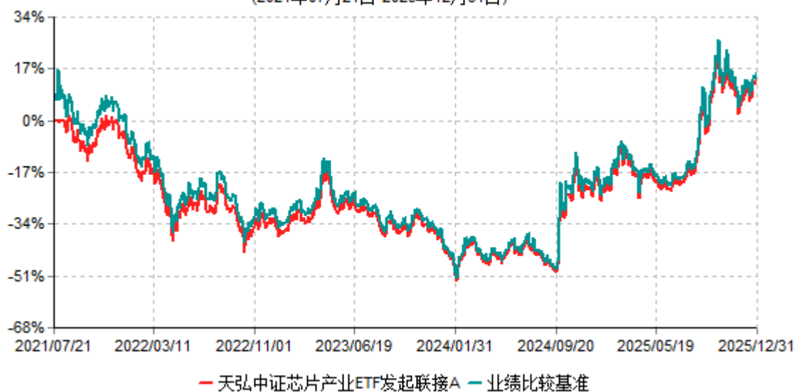
天弘中证芯片产业ETF发起联接A累计净值增长率与业绩比较基准收益率历史走势对比图 (2021年07月21日-2025年12月31日)