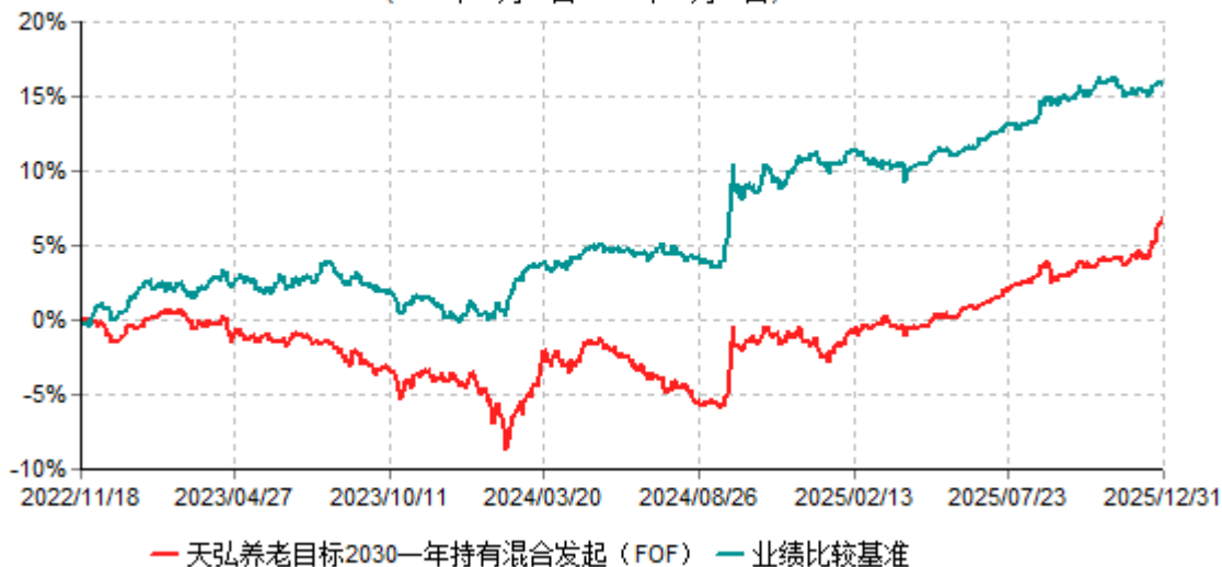
天弘养老目标2030一年持有混合发起（FOF）累计净值增长率与业绩比较基准收益率历史走势对比图 (2022年11月18日-2025年12月31日)

注：1、本基金合同于2022年11月18日生效。 2、本报告期内，本基金的各项投资比例达到基金合同约定的各项比例要求。