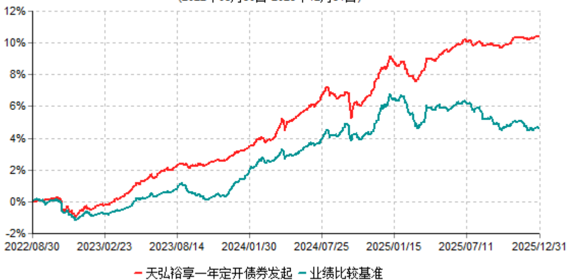
天弘裕享一年定开债券发起累计净值增长率与业绩比较基准收益率历史走势对比图 (2022年08月30日-2025年12月31日)