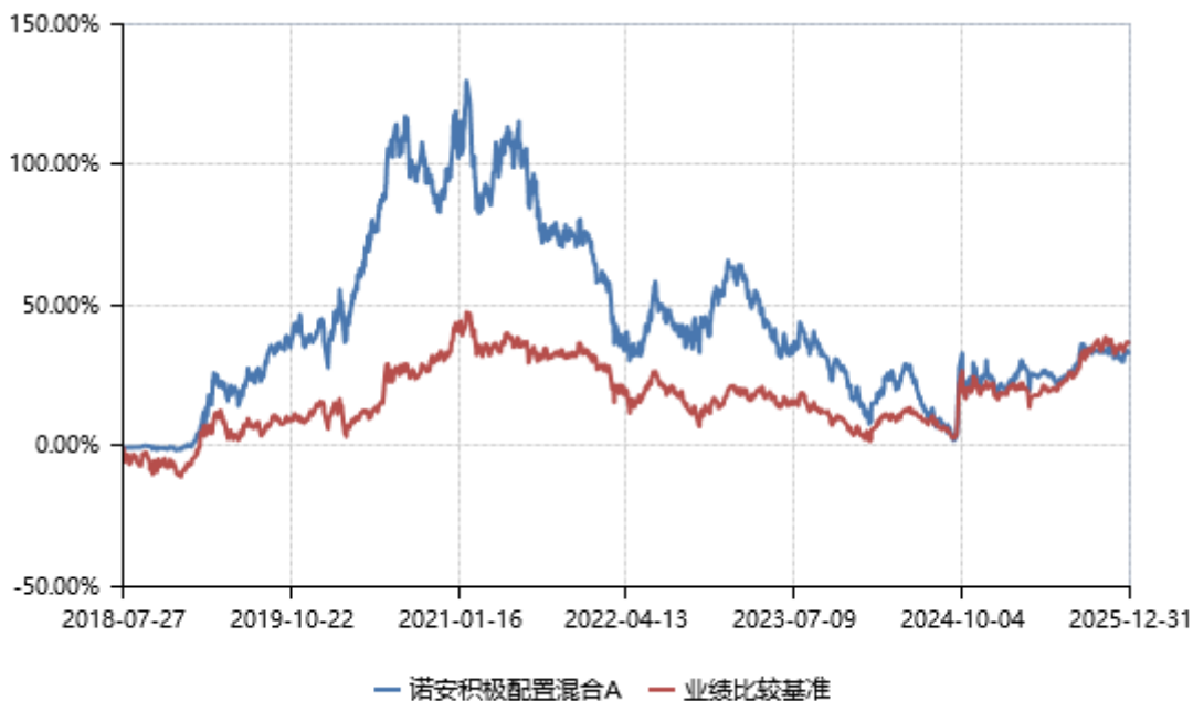
诺安积极配置混合 C