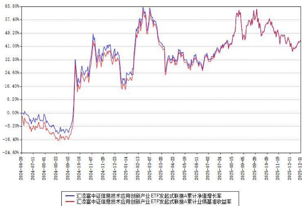
汇添富中证信息技术应用创新产业ETF发起式联接A累计净值增长率与同期业绩比较基准收益率对比图