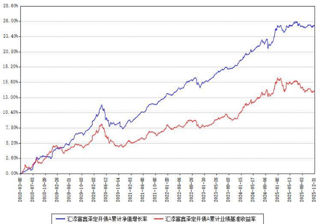
汇添富鑫泽定开债A累计净值增长率与同期业绩基准收益率对比图

注：本基金建仓期为本《基金合同》生效之日（2018年03月08日）起6个月，建仓期结