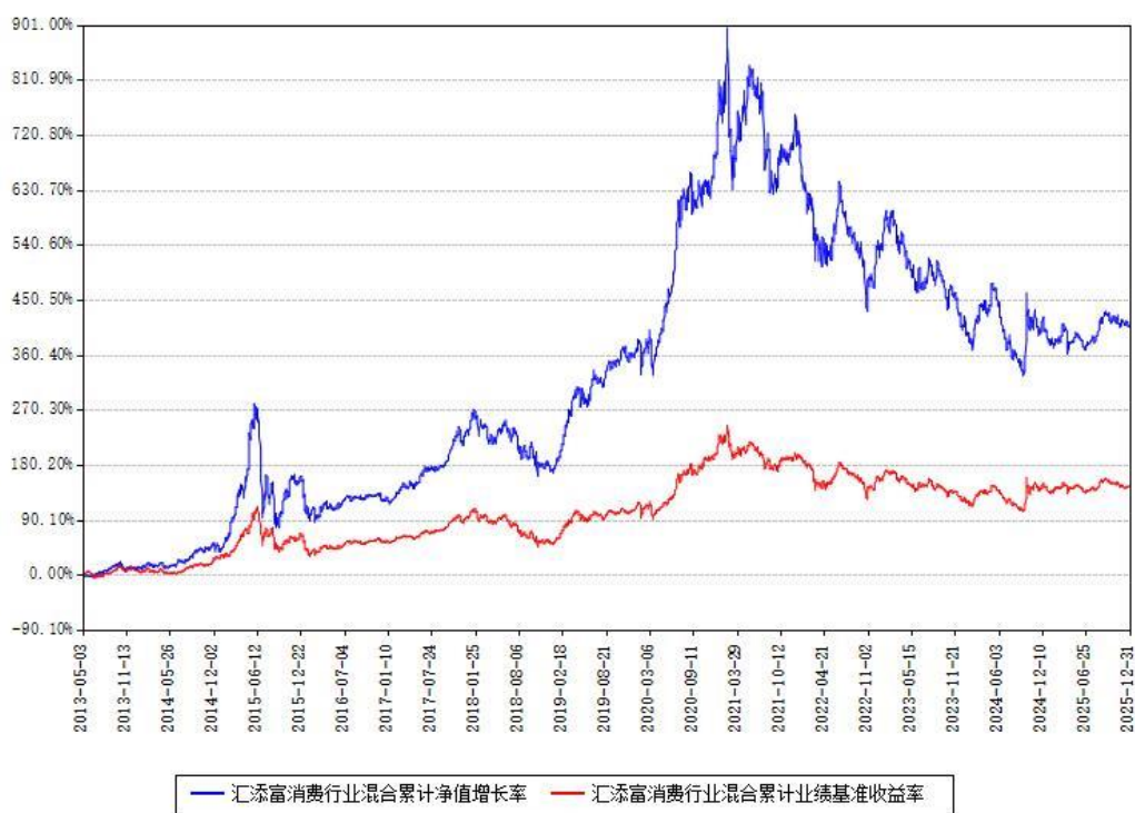
汇添富消费行业混合累计净值增长率与同期业绩比较基准收益率对比图

注：本基金建仓期为本《基金合同》生效之日（2013年05月03日）起6个月，建仓期结束时各项资产配置比例符合合同约定。