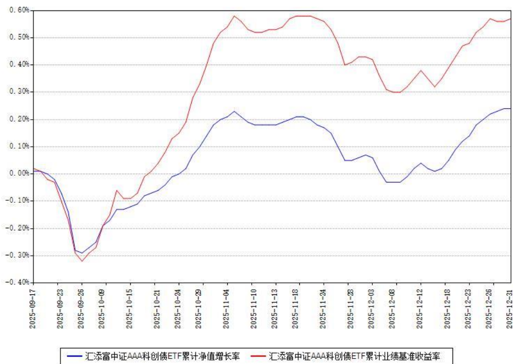
汇添富中证AAA科创债ETF累计净值增长率与同期业绩基准收益率对比图

注：本《基金合同》生效之日为 2025 年 09 月 17 日，截至本报告期末，基金成立未满一年。本基金建仓期为本《基金合同》生效之日起 6 个月，截至本报告期末，本基金尚处于建仓期中。