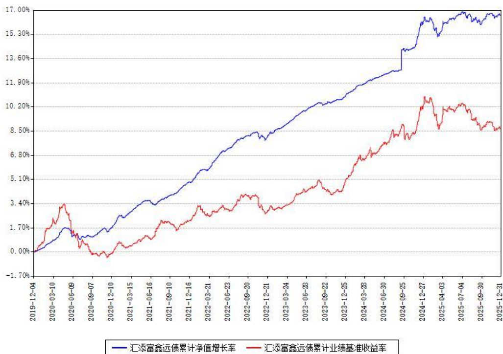
汇添富鑫远债累计净值增长率与同期业绩基准收益率对比图

注：本基金建仓期为本《基金合同》生效之日（2019年12月04日）起6个月，建仓期结束时各项资产配置比例符合合同约定。