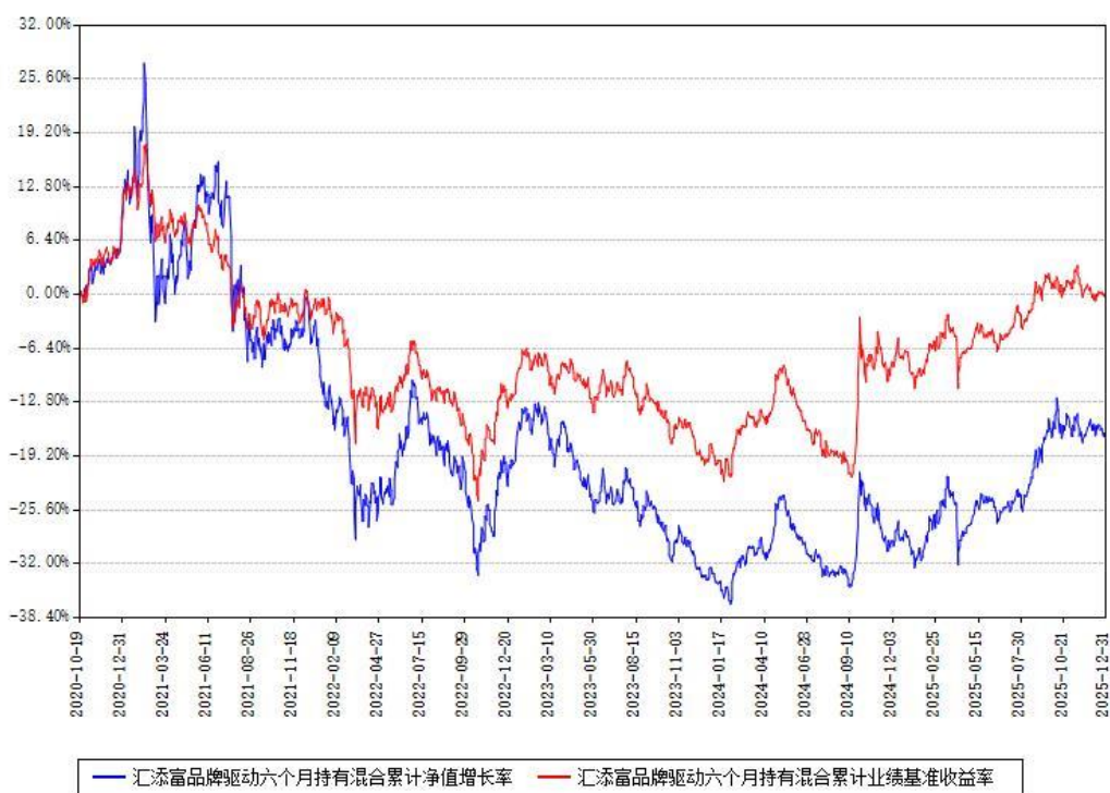
汇添富品牌驱动六个月持有混合累计净值增长率与同期业绩比较基准收益率对比图

注：本基金建仓期为本《基金合同》生效之日（2020年10月19日）起6个月，建仓期结束时各项资产配置比例符合合同约定。