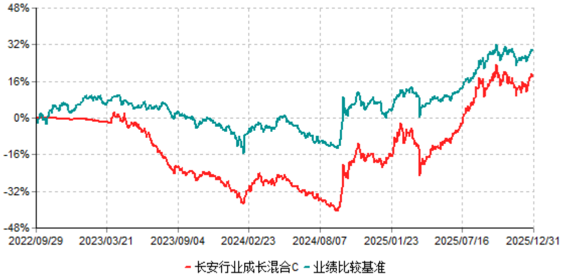
长安行业成长混合C累计净值增长率与业绩比较基准收益率历史走势对比图 (2022年09月29日-2025年12月31日)

根据基金合同的规定,自基金合同生效之日起6个月内基金各项资产配置比例需符合基金合同要求。本基金在建仓期结束后,各项资产配置比例已符合基金合同有关投资比例的约定。本基金于2022年9月29日成立,基金合同生效日至报告期末,本基金运作时间已满一年。图示日期为2022年9月29日至2025年12月31日。