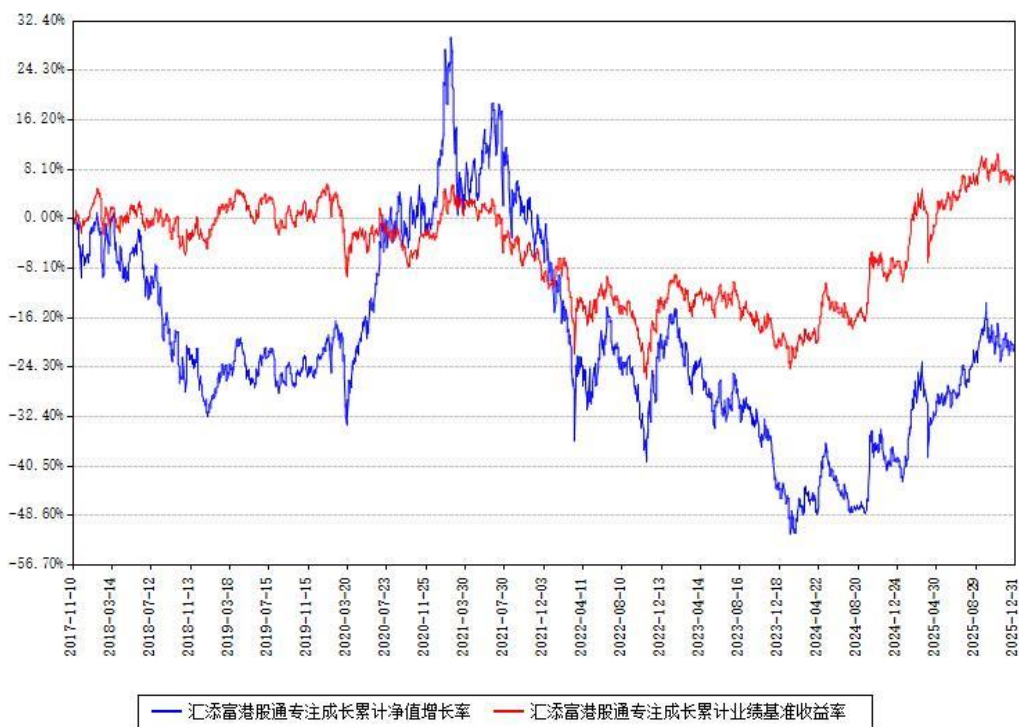
汇添富港股通专注成长累计净值增长率与同期业绩基准收益率对比图

注：本基金建仓期为本《基金合同》生效之日（2017年11月10日）起6个月，建仓期结束时各项资产配置比例符合合同约定。