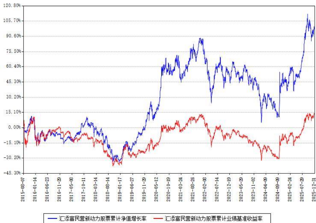
汇添富民营新动力股票累计净值增长率与同期业绩基准收益率对比图

注：本基金建仓期为本《基金合同》生效之日（2015年08月07日）起6个月，建仓期结束时各项资产配置比例符合合同约定。