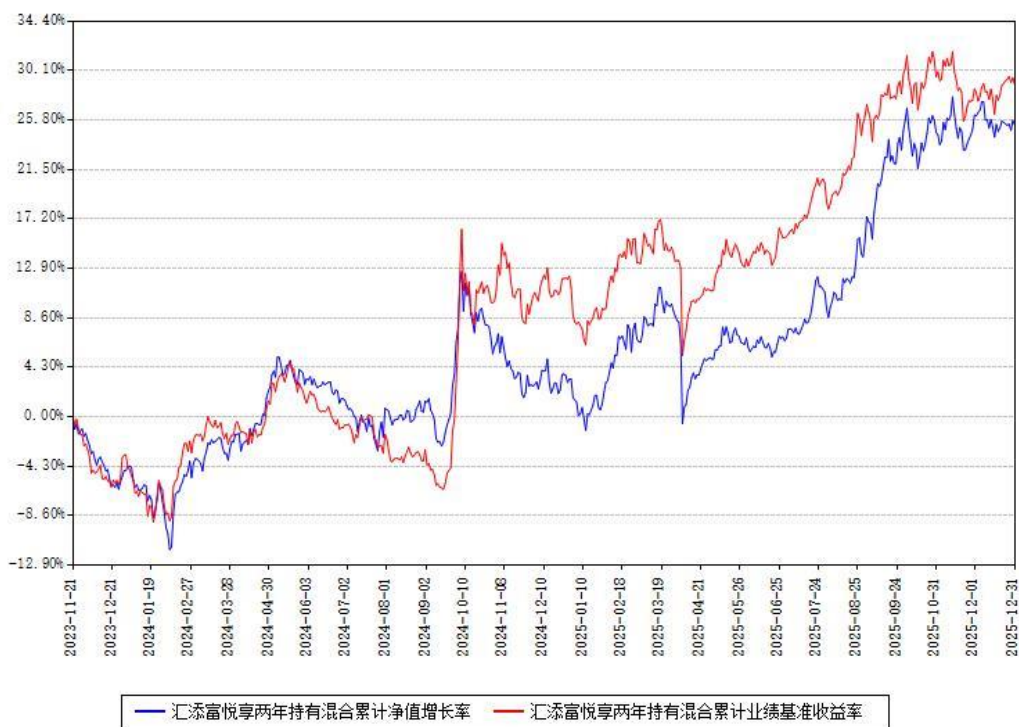
汇添富悦享两年持有混合累计净值增长率与同期业绩基准收益率对比图

注：本基金建仓期为本《基金合同》生效之日（2023 年 11 月 21 日）起 6 个月，建仓期结束时各项资产配置比例符合合同约定。