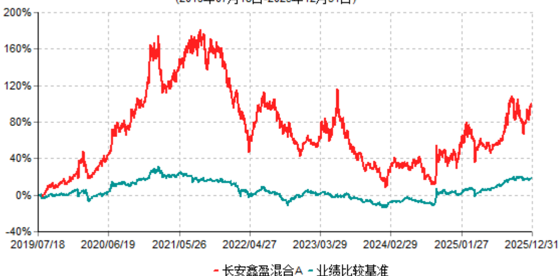
长安鑫盈混合A累计净值增长率与业绩比较基准收益率历史走势对比图 (2019年07月18日-2025年12月31日)

根据基金合同的规定,自基金合同生效之日起6个月内基金各项资产配置比例需符合基金合同要求。本基金在建仓期结束后,各项资产配置比例已符合基金合同有关投资比例的约定。基金合同生效日至报告期期末,本基金运作时间超过一年。图示日期为2019年07月18日至2025年12月31日止。