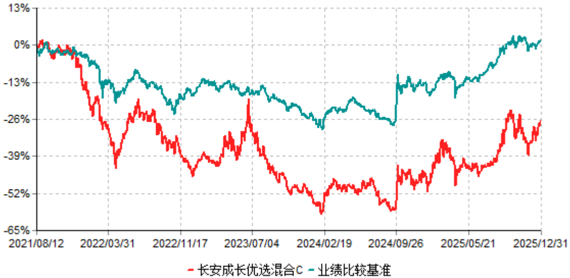
长安成长优选混合C累计净值增长率与业绩比较基准收益率历史走势对比图 (2021年08月12日-2025年12月31日)

根据基金合同的规定,自基金合同生效之日起6个月内基金各项资产配置比例需符合基金合同要求。本基金在建仓期结束后,各项资产配置比例已符合基金合同有关投资比例的约定。基金合同生效日至报告期末,本基金运作时间已满一年。图示日期为2021年8月12日至2025年12月31日。