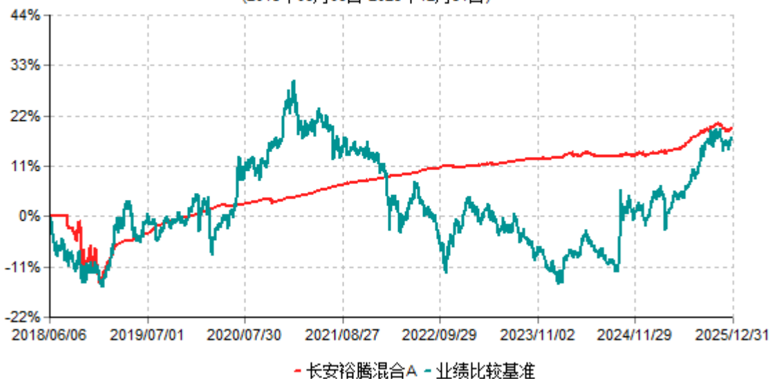
长安裕腾混合A累计净值增长率与业绩比较基准收益率历史走势对比图 (2018年06月06日-2025年12月31日)

根据基金合同的规定,自基金合同生效之日起6个月内基金各项资产配置比例需符合基金合同要求。本基金在建仓期结束后,各项资产配置比例已符合基金合同有关投资比例的约定。基金合同生效日至报告期末,本基金运作时间已满一年。图示日期为2018年6月6日至2025年12月31日。