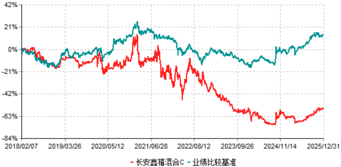
长安鑫禧混合C累计净值增长率与业绩比较基准收益率历史走势对比图 (2018年02月07日-2025年12月31日)

根据基金合同的规定,自基金合同生效之日起6个月内基金各项资产配置比例需符合基金合同要求。本基金在建仓期结束后,各项资产配置比例已符合基金合同有关投资比例的约定。基金合同生效日至报告期期末,本基金运作时间超过一年。图示日期为2018年2月7日至2025年12月31日。