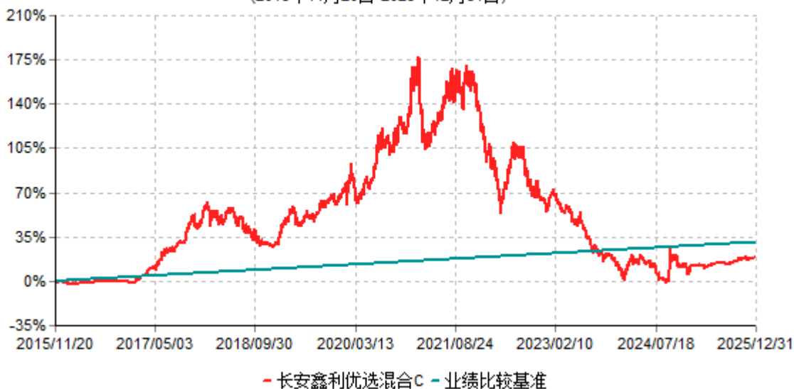
长安鑫利优选混合C累计净值增长率与业绩比较基准收益率历史走势对比图 (2015年11月20日-2025年12月31日)

长安鑫利优选混合于2015年11月17日公告新增C类份额，实际首笔C类份额申购申请于2015年11月20日确认，图示日期为2015年11月20日至2025年12月31日。