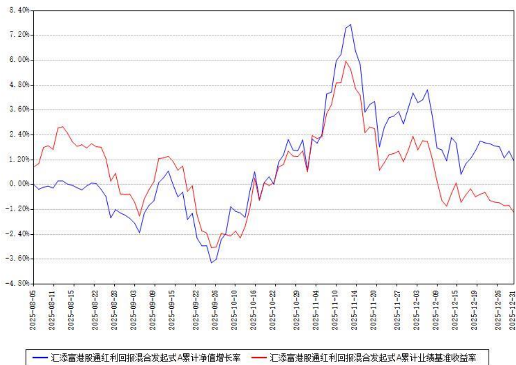
汇添富港股通红利回报混合发起式A累计净值增长率与同期业绩基准收益率对比图