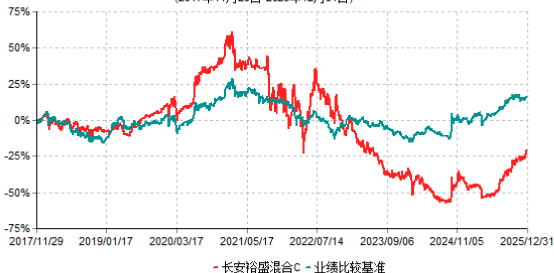
长安裕盛混合C累计净值增长率与业绩比较基准收益率历史走势对比图 (2017年11月29日-2025年12月31日)

根据基金合同的规定,自基金合同生效之日起6个月内基金各项资产配置比例需符合基金合同要求。本基金在建仓期结束后,各项资产配置比例已符合基金合同有关投资比例的约定。基金合同生效日至报告期期末,本基金运作时间超过一年。图示日期为2017年11月29日至2025年12月31日。