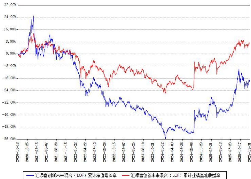
汇添富创新未来混合（LOF）累计净值增长率与同期业绩比较基准收益率对比图

注：本基金建仓期为本《基金合同》生效之日（2020年10月13日）起6个月，建仓期结