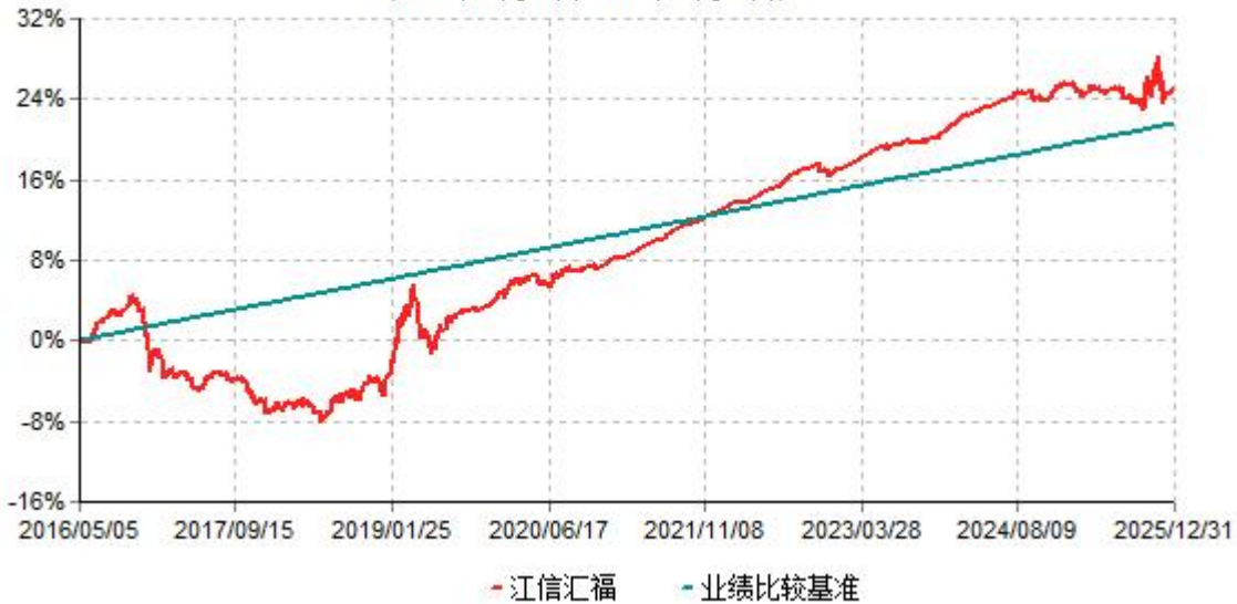
江信汇福累计净值增长率与业绩比较基准收益率历史走势对比图 (2016年05月05日-2025年12月31日)