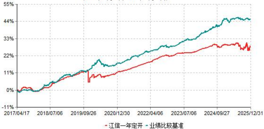
江信一年定开累计净值增长率与业绩比较基准收益率历史走势对比图 (2017年04月17日-2025年12月31日)