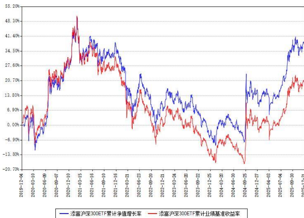
添富沪深300ETF累计净值增长率与同期业绩基准收益率对比图

注：本基金建仓期为本《基金合同》生效之日（2019年12月04日）起6个月，建仓期结束时各项资产配置比例符合合同约定。