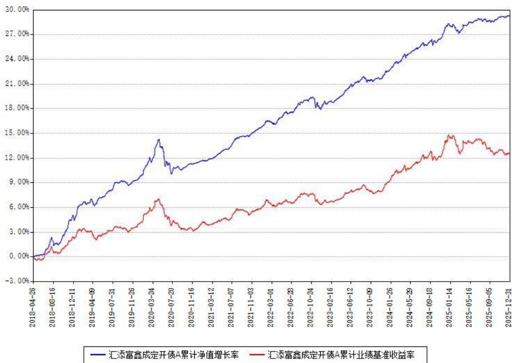
汇添富鑫成定开债A累计净值增长率与同期业绩基准收益率对比图

注：本基金建仓期为本《基金合同》生效之日（2018年04月26日）起6个月，建仓期结束时各项资产配置比例符合合同约定。