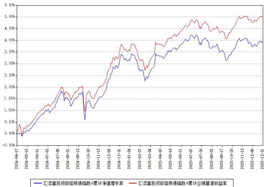
汇添富投资级信用债指数A累计净值增长率与同期业绩基准收益率对比图