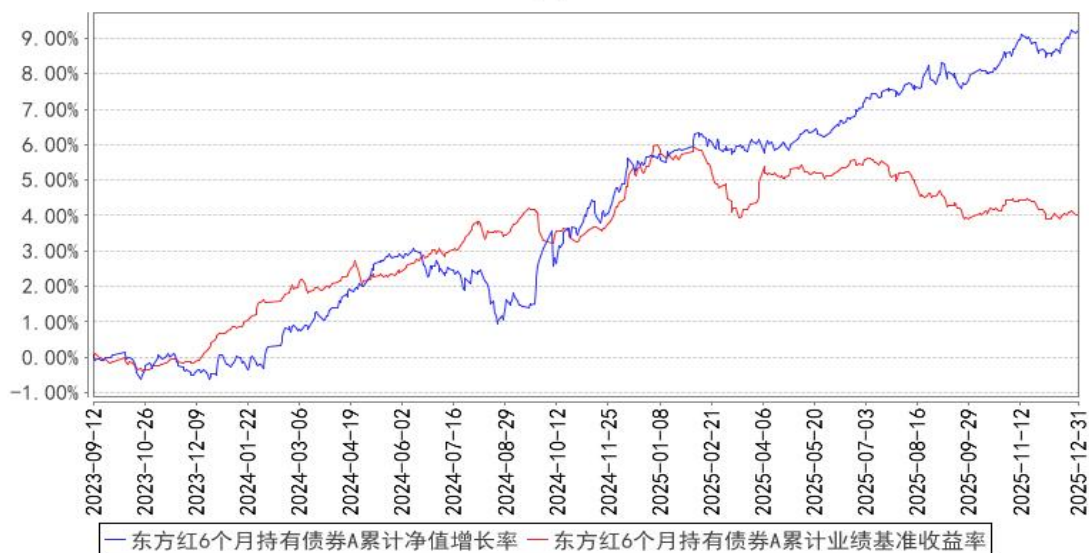
东方红6个月持有债券A累计净值增长率与同期业绩比较基准收益率的历史走势对比图