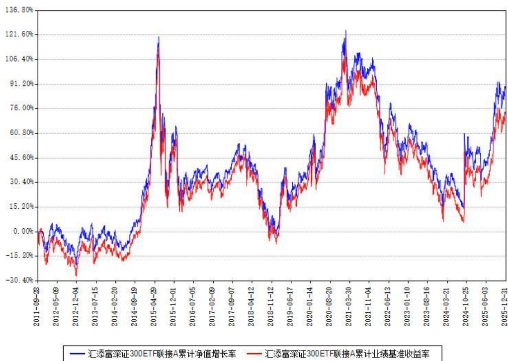
汇添富深证300ETF联接A累计净值增长率与同期业绩比较基准收益率对比图