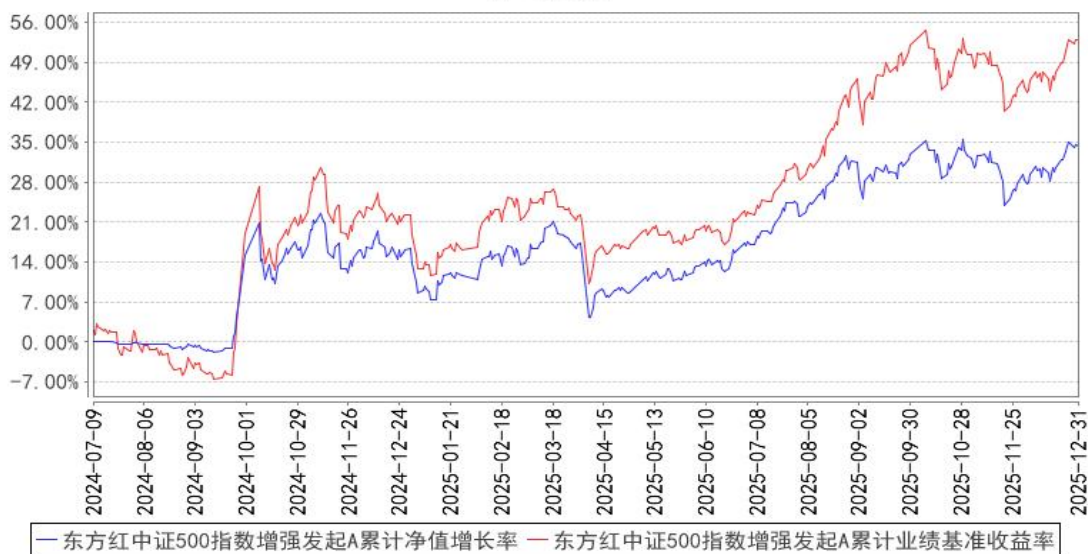
东方红中证500指数增强发起A累计净值增长率与同期业绩比较基准收益率的历史走势对比图