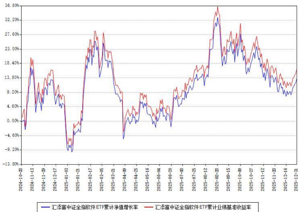
汇添富中证全指软件ETF累计净值增长率与同期业绩基准收益率对比图

注：本基金建仓期为本《基金合同》生效之日（2024年10月28日）起6个月，建仓期结束时各项资产配置比例符合合同约定。