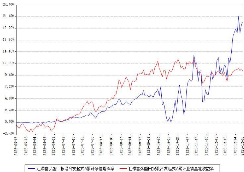
汇添富弘盛回报混合发起式A累计净值增长率与同期业绩基准收益率对比图