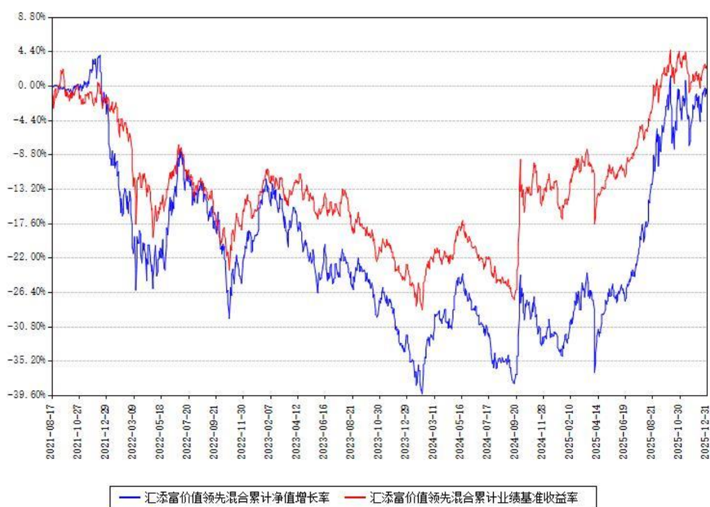
汇添富价值领先混合累计净值增长率与同期业绩比较基准收益率对比图

注：本基金建仓期为本《基金合同》生效之日（2021年08月17日）起6个月，建仓期结束时各项资产配置比例符合合同约定。