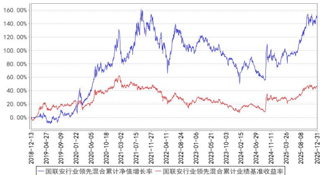
国联安行业领先混合累计净值增长率与同期业绩比较基准收益率的历史走势对比图

注：1、本基金的业绩比较基准为沪深 300 指数×75%+上证国债指数×25%； 2、本基金基金合同于 2018 年 12 月 13 日生效； 3、本基金建仓期为自基金合同生效之日起的 6 个月，建仓期结束时各项资产配置符合合同约定。