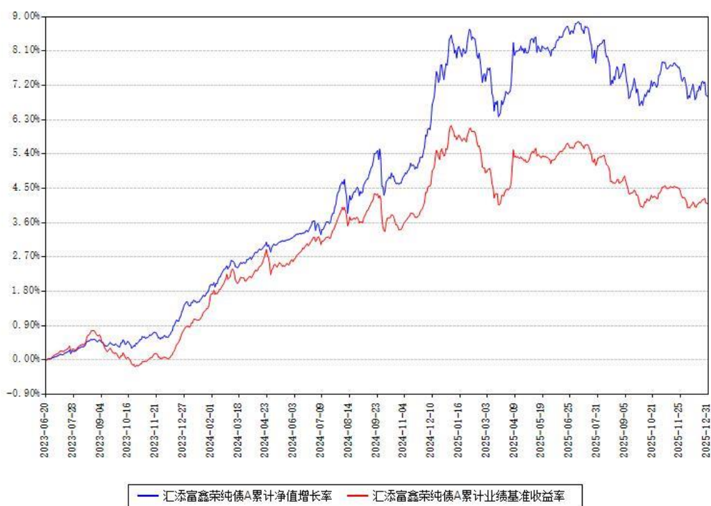
汇添富鑫荣纯债A累计净值增长率与同期业绩基准收益率对比图