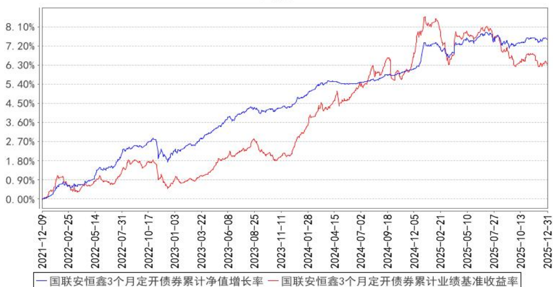
国联安恒鑫3个月定开债券累计净值增长率与同期业绩比较基准收益率的历史走势图