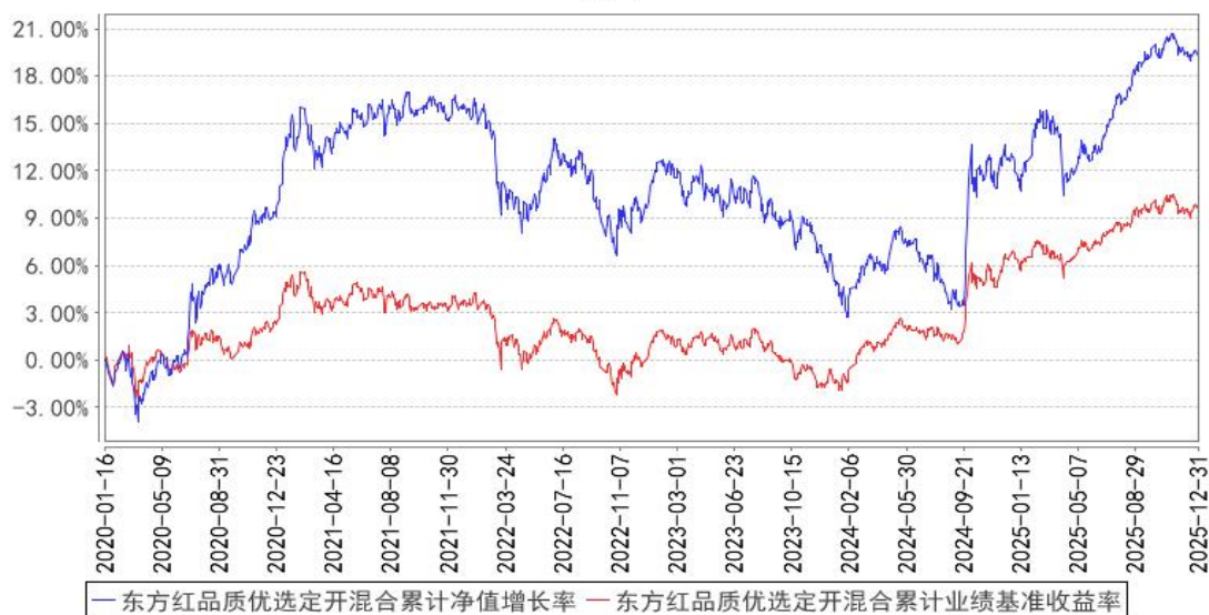
东方红品质优选定开混合累计净值增长率与同期业绩比较基准收益率的历史走势对比图