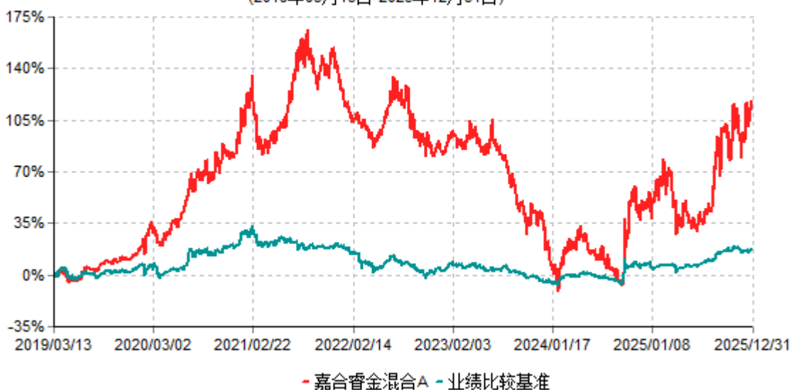
嘉合睿金混合A累计净值增长率与业绩比较基准收益率历史走势对比图 (2019年03月13日-2025年12月31日)

注：1、本基金于2019年3月13日由"嘉合睿金定期开放灵活配置混合型发起式证券投资基金"转型而来。