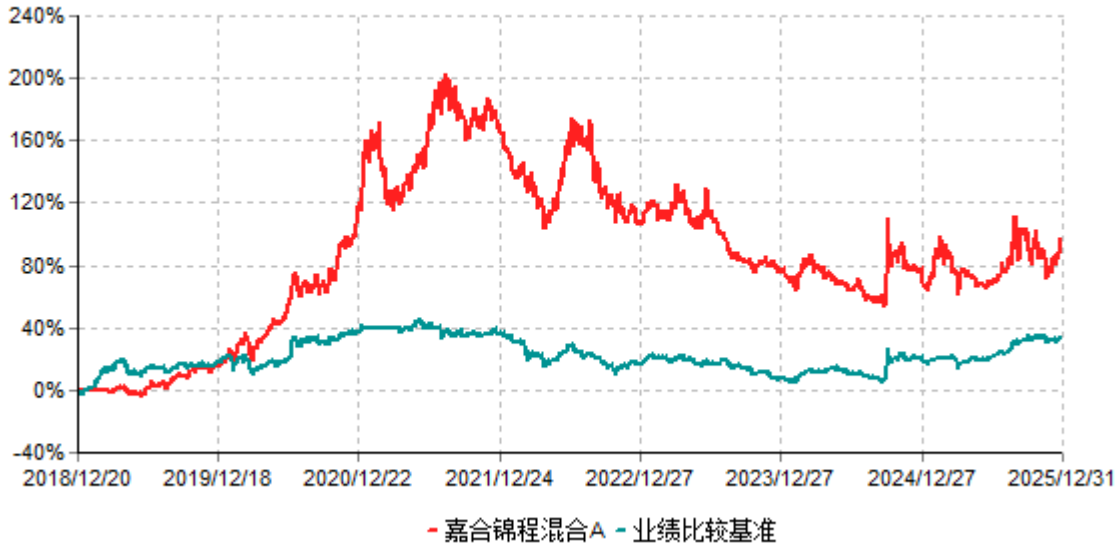
嘉合锦程混合A累计净值增长率与业绩比较基准收益率历史走势对比图 (2018年12月20日-2025年12月31日)